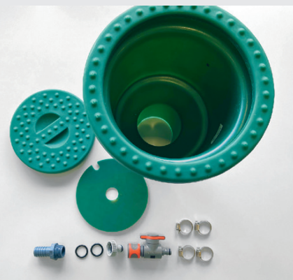
Entnahmestelle Fontana S